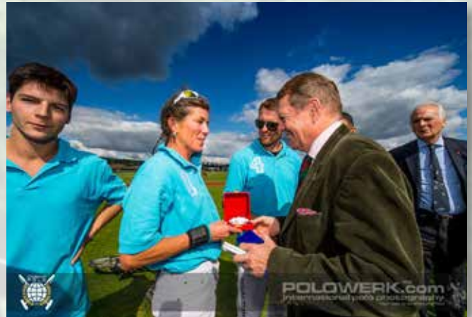
Price giving ceremony