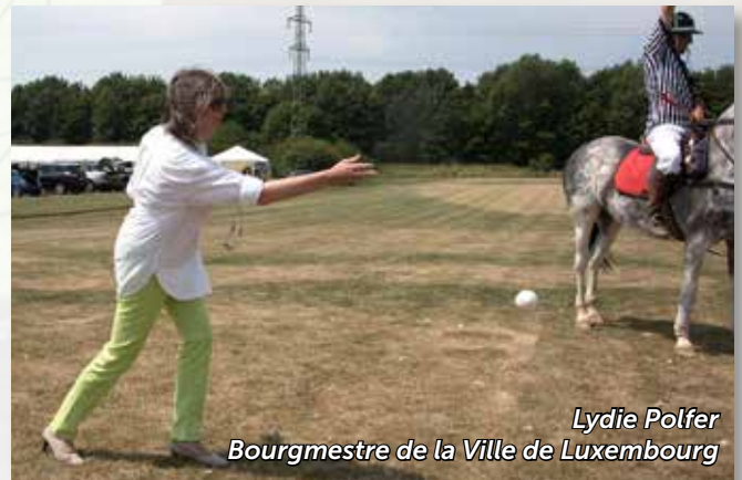
Lydie Polfer Bourgmestre de la Ville de Luxembourg