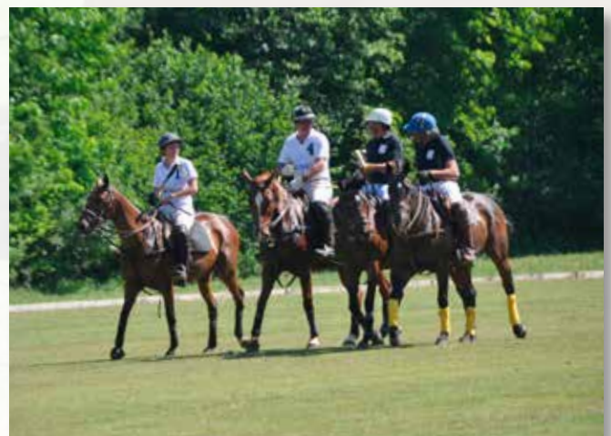
Four teams from France and Luxembourg played for the 4th Macon Polo Cup