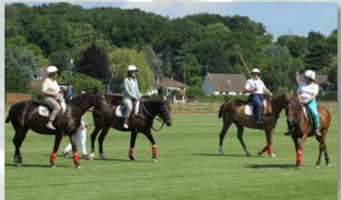
sympathique jardin du club house du Polo Club du Domaine de Chantilly.