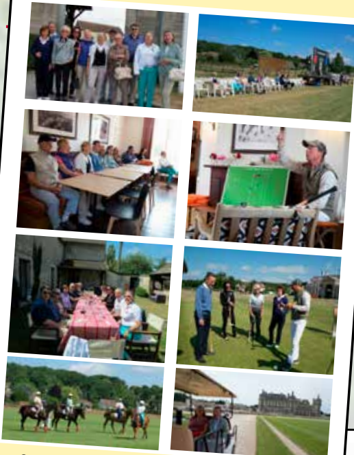
Quelques impressions du week-end à Chantilly des groupes d'intérêts « Polo » et « Golf »