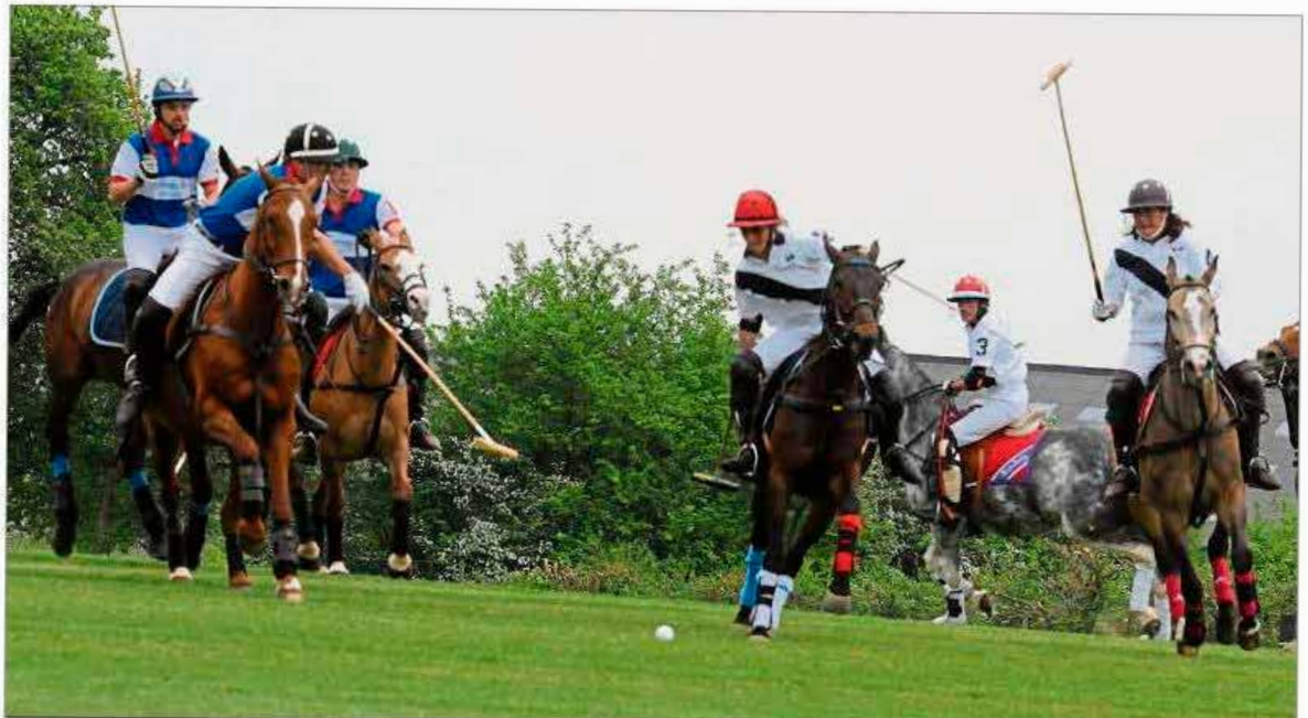
Die Polospieler treffen sich drei Mal pro Woche, um ein Spiel zu bestreiten. Dabei darf der Schläger nur in der rechten Hand gehalten werden, damit sich niemand verletzt.

Der „Polo Club Luxembourg“ kann bereits zehn erfolgreiche Bestandsjahre verbuchen. Der Verein, der in Luxemburg ansässig ist, zählt derzeit 13 aktive Spieler sowie 13 Nachwuchssportler in der Poloschule. Weitere fünf Sportler befinden sich in der Ausbildung.